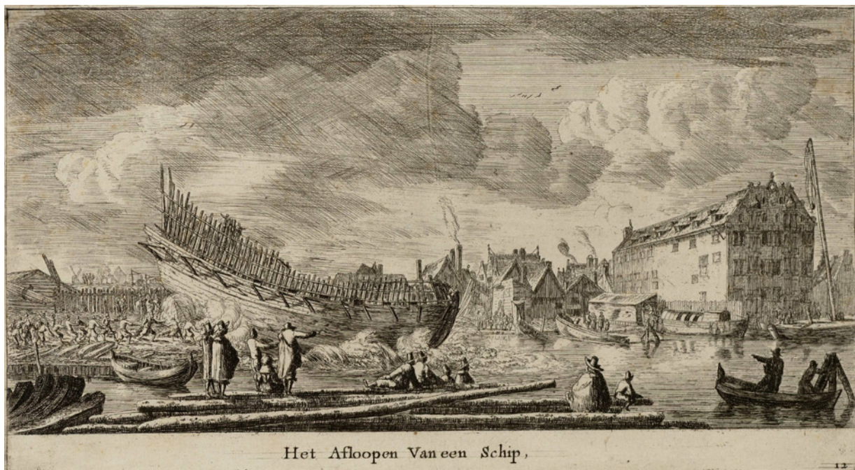
Het Afloopen Van een Schip,

3 Reinier Nooms en Reinier Zeeman, Het Afloopen Van een Schip , circa 1655. Ets, 13,7 x 24,7 cm. Stadsarchief Amsterdam (010097004247). Dit was de nog vrijwel onbebouwde IJgracht (ter hoogte van de huidige Prins Hendrikkade 176) tijdens een tewaterlating op de werf van de Verenigde Oost-Indische Compagnie (VOC) tussen de Foeliestraat en de Peperstraat. Links hiervan stonden de pakhuizen van de West-Indische Compagnie (WIC) waarin eerst het Armen-Kinder-Werkhuis en daarna het Nieuwe Werkhuis / Willige Rasphuis werden gehuisvest.