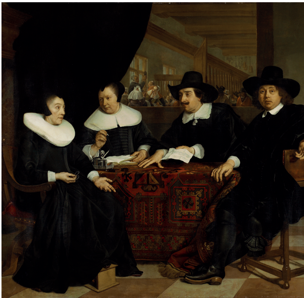
7 Bartholomeus van der Helst, Portret van twee regenten en twee regentessen van het Amsterdamse Spinhuis , 1650. Olieverf op doek, 233 x 317 cm. Amsterdam Museum (A 4367).